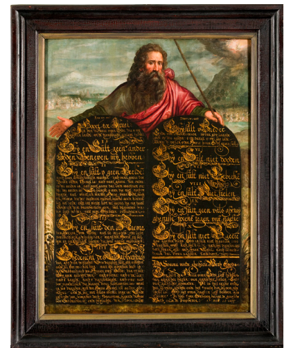
Tiengebodenbord met Mozes Noordelijke Nederlanden, eerste kwart 17e eeuw