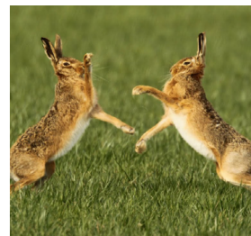
Boksende hazen, om de gunst van een vrouwtje