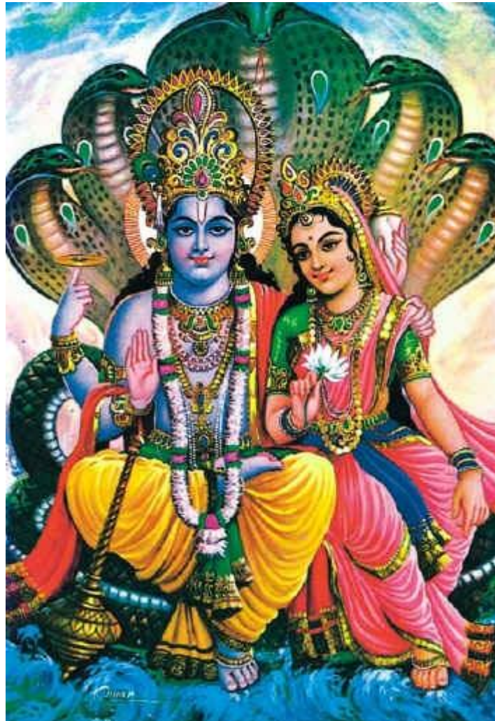
Koning Dasrath en Koningin Sita

dat zijn land een voorbeeld zou zijn voor alle landen op de wereld. Ieder kwaad roeide hij uit, want kwaad hoort bij donker, vond koning Rama. En het land van Rama moest alleen maar een land van het licht zijn. Ondanks zijn roem bleef koning Rama toch eenvoudig. Na zijn dood vereerden de mensen van zijn rijk hem als een god. Een god die licht bracht en vocht tegen de duisternis.