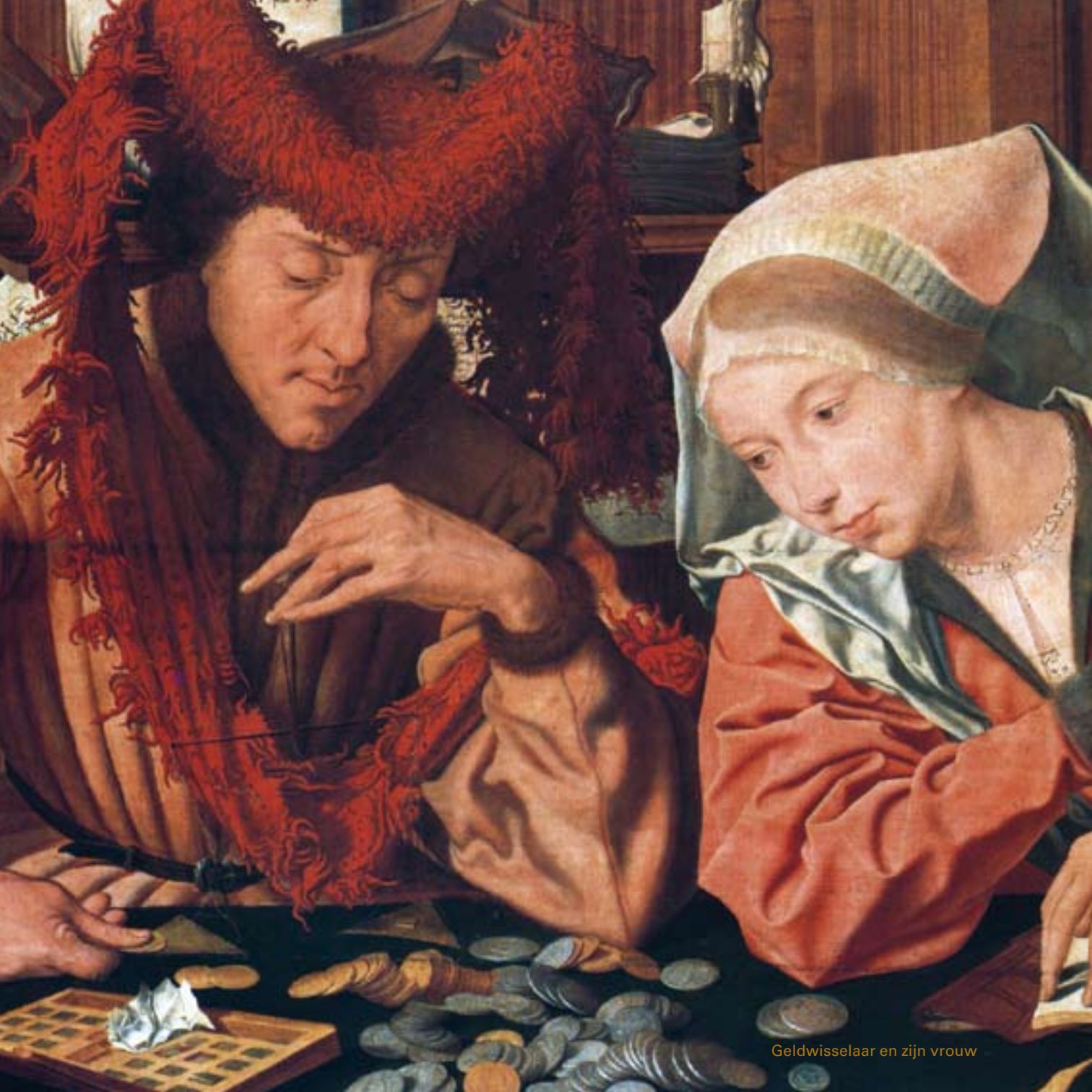
Geldwisselaar en zijn vrouw