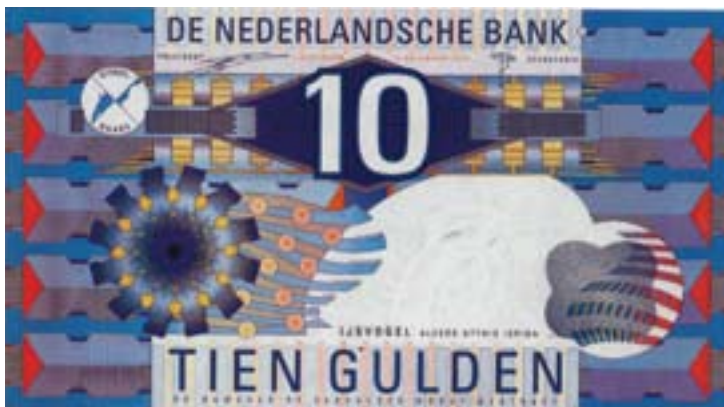
Laatste biljet: 10 gulden