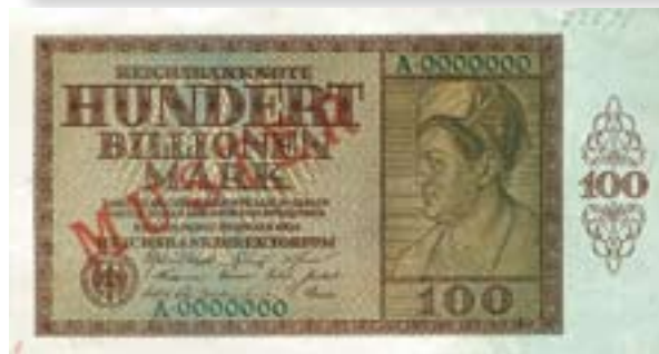
Duits hyperinflatie geld