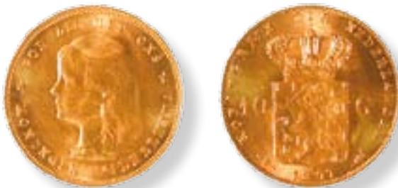
Gouden tientje van Wilhelmina

Op de voorkant van de munten stond voortaan altijd een portret van de Nederlandse koning: Willem I, Willem II en Willem III. Sinds 1890 is dat overigens altijd een koningin geweest: achtereenvolgens Emma (regentes voor de nog te jonge Wilhelmina), Wilhelmina, Juliana en Beatrix.