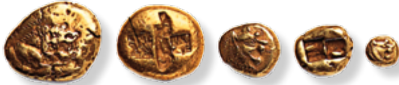
Goud- en zilverklompjes

... de Latijnse naam voor de kaurischelp monetaria moneta is? Het grappige is dat in deze naam het woord 'moneta' voorkomt. Dat is het Italiaanse woord voor geld. In Engelstalige landen zeggen ze 'money' en in Frankrijk 'monnaie'. En wij bergen ons geld op in een portemonnee, een 'gelddrager'.