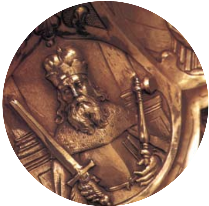
Karel de Grote

Karel de Grote (742-814) was een belangrijke Frankische keizer in de vroege Middeleeuwen. Hij koos de Duitse stad Aken tot hoofdstad van zijn rijk. Hoewel Karel nauwelijks kon lezen of schrijven, was hij een slimme heerser, die zijn rijk goed organiseerde en bestuurd. Op het terrein van het geld voerde hij een eenheidsmaat in, het pond. Het pond werd niet alleen een standaardmaat voor gewicht, maar ook voor geld: een pond was 450 gram. Hier werden 20 solidi (schellingen) van ieder 12 denarii (penningen; ooit een van de meest gebruikte munten in