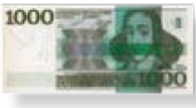
Erflaters van Oxenaar