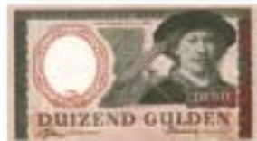
Erflaters van Doeve