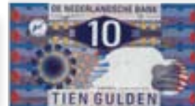
De tientjes van de vorige eeuw